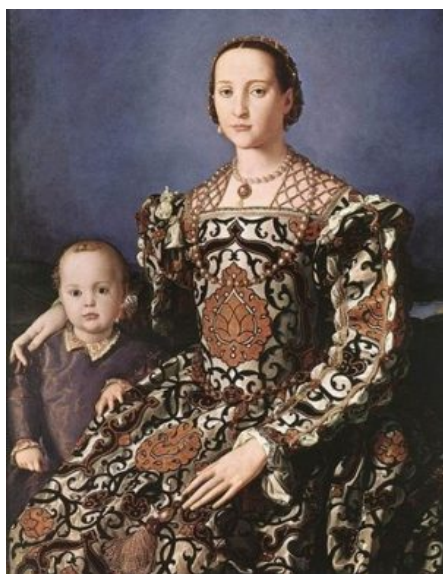
Bronzino: Toledói Eleonóra

Gli sposi in un primo momento si stabilirono nel palazzo di via Larga (l'attuale Palazzo Medici Riccardi di via Cavour), ma di lì a poco si trasferirono a Palazzo Vecchio, l'edificio simbolo di Firenze, scelto per due ragioni fondamentali: perché era l'emblema del potere politico e perché era più facilmente difendibile. Cosimo volle aumentare ulteriormente la sua incolumità ingaggiando un corpo di guardia permanente, composto perlopiù da soldati scelti di provenienza prevalentemente svizzera, lautamente pagati e perciò fedelissimi al duca. Alcuni settori del palazzo vennero trasformati in comodi appartamenti adatti alle esigenze della coppia, che si rivelò particolarmente indovinata ed affiatata, con ogni probabilità la meglio riuscita tra le tante unioni infelici della casata, segnata non di rado da veri e propri drammi coniugali. Nel giro di quattordici anni Cosimo ed Eleonora furono rallegrati dalla nascita di undici figli, desiderati ed amatissimi dai genitori, che si occuparono assiduamente della loro prole: Maria (1540 - 1557), Francesco (1541 - 1587), Isabella (1542 - 1576), Giovanni (1543 - 1562), Lucrezia (1544 o 1545 - 1561), Pedricco (1546 - 1547), Garzia (1547 - 1562), Antonio (nato e morto nel 1548), Ferdinando (1549 - 1609), Anna (nata e morta nel 1553) e Pietro (1554 - 1604).